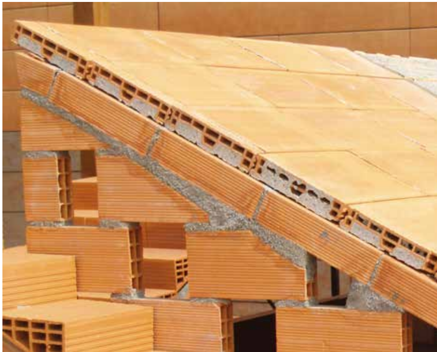
SECCIÓN TRANSVERSAL COTAS EN mm.

Descarga la hoja técnica de Bardopret Cubiertas para ampliar tu información.